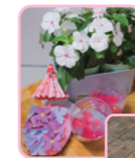
自由時間は好きなことをしてお過ごし頂けます