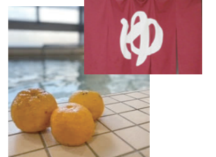
冬は、ゆず湯に入浴