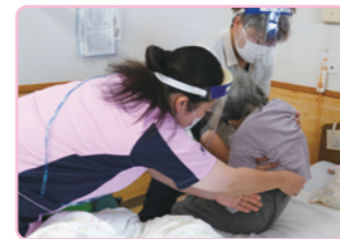
万全な体制でサポートします