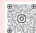
インスタのQRコード

E-mail. careoomiya@maruyamakai.or.jp HP. https://careoomiya.maruyamakai.jp Instagram. CARE.OOMIYA.HANANOOKA