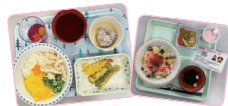
管理栄養士が考案した栄養バランスの取れた手作りメニュー（施設内で調理）が提供されます