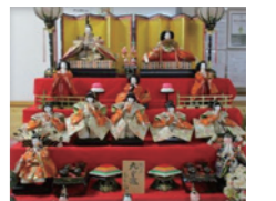
年間を通し、行われる季節の行事も好評です！