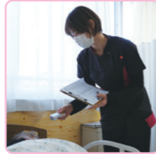
看護師による体調のチェック